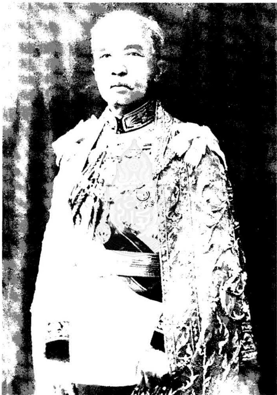
สมเด็จพระเจ้าบรมวงศ์เธอ กรมพระยาดำรงราชานุภาพ